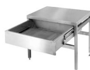
不锈钢底座连下水抽屉