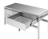
不锈钢底座连下水抽屉